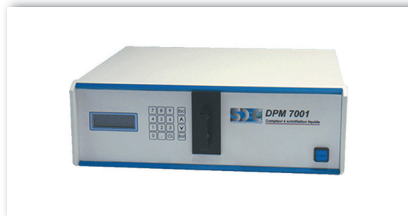
DPM7001 - tiroir de chargement fermé.